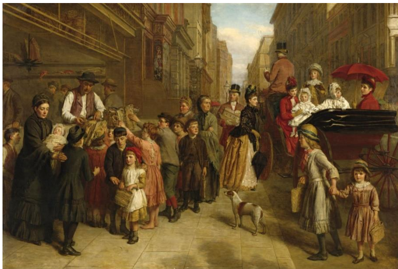
Уильям Паулз Фрайт «Бедность и богатство»

Однажды у Ярославского вокзала ходил важный господин, тайный советник*. Он радовался жизни, смотря на мрамор, стеклянные окна, рестораны с официантами, обслуживающими посетителей, радостных людей, которые вежливо снимали перед ним шляпу. Но внезапно он увидел тихого грустного человека. Тайному советнику это очень не понравилось: он считал, что все должны действовать ему в угоду, он был очень разозлён. Сегодня он как раз встал с той ноги и хотел, чтобы все были весёлыми. Но тут все его планы рухнули... Он в гневе подошёл к незнакомцу, от которого пахло бедностью, грустью, гробовым запахом, бутербродом, водой и дешевым кофе. Иванов был чем-то озабочен.