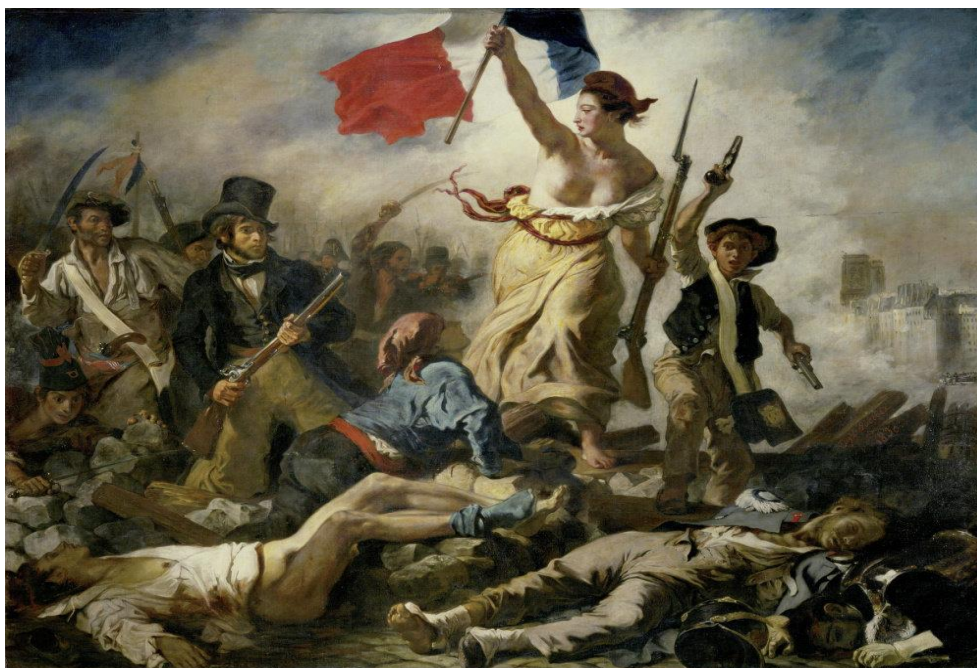
Свобода, ведущая народ. Эжен Делакруа. Романтизм

Чаще всего литература этого удивительного периода делится на две огромные категории, составляющие вершину мировой литературы: романтизм и реализм . Эти направления мы можем видеть не только в книгах: ещё, к примеру, в живописи.