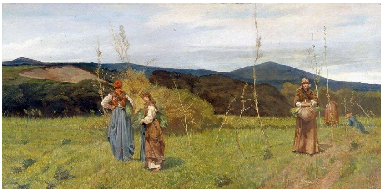
Джованни Фаттори. Три крестьянина в поле. Реализм